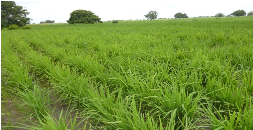
Parcelle de riz pluviale