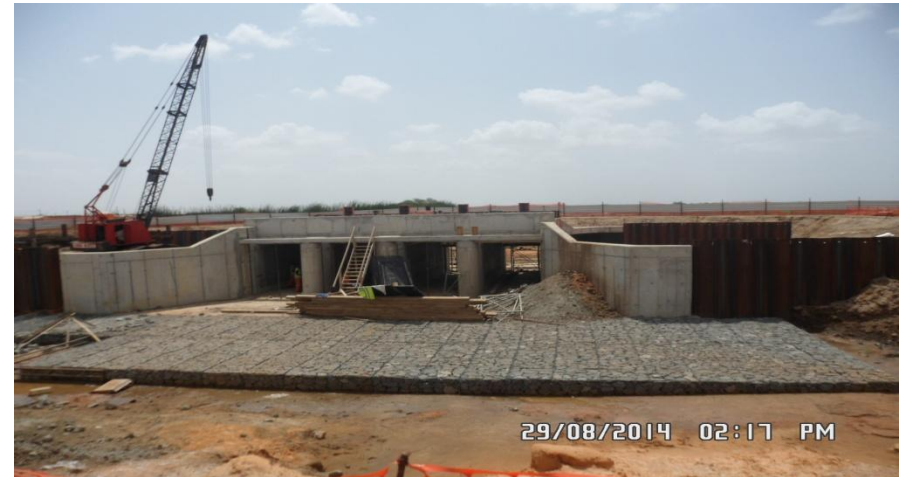
Barrage en construction